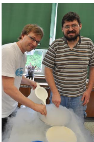
Vaříme s dusíkem